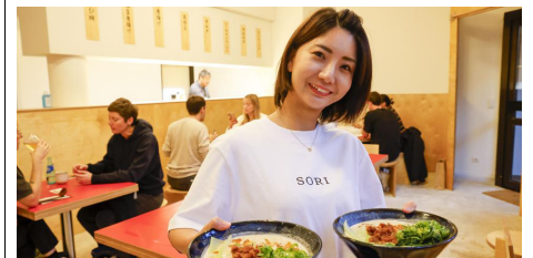
Sori Ramen: Nudelsuppen vom japanischen Meisterkoch am Kaiser-Wilhelm-Ring