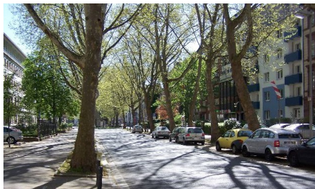
111 Bäume für die Mainzer Neustadt – Bürger*innen können konkrete Standorte vorschlagen