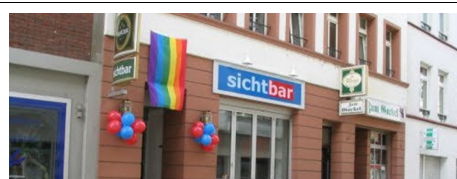
20 Jahre „Bar jeder Sicht“: „Die Leute haben so einen Raum gebraucht“