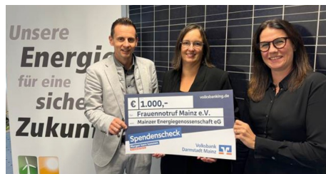
Mainzer Energiegenossenschaft eG spendet 1000,-€ an den Frauennotruf Mainz