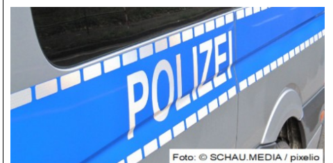
Verkehrsunfall mit Personenschaden auf der Rheinallee