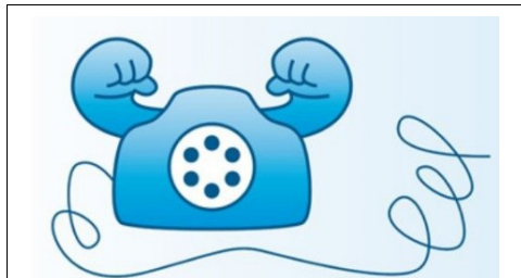
Gesundheitstelefon: Geistig fit bleiben – Tipps für ein gesundes Gehirn