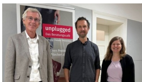
Aktionstag für seelische Gesundheit: Unkomplizierte Unterstützung für junge Erwachsene mit psychischen Problemen im „unplugged – das Beratungscafé“