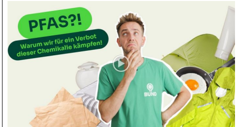
Ökotipp: So vermeiden Sie PFAS in der Küche